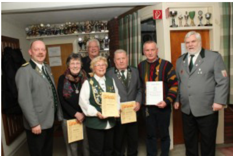
Die Geehrten 2014